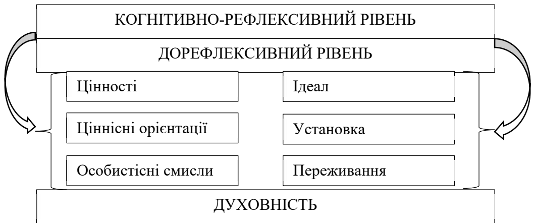
Рис. 1. Модель ціннісно-сислової сфери майбутнього фахівця

Необхідно відзначити, що представлений перелік не можна вважати ієрархізованою структурою, оскільки, на нашу думку, системо утворювальним компонентом ціннісно-сислової сфери є духовність особистості, а інші компоненти є рядоположеними та принципово неієрархізованими.