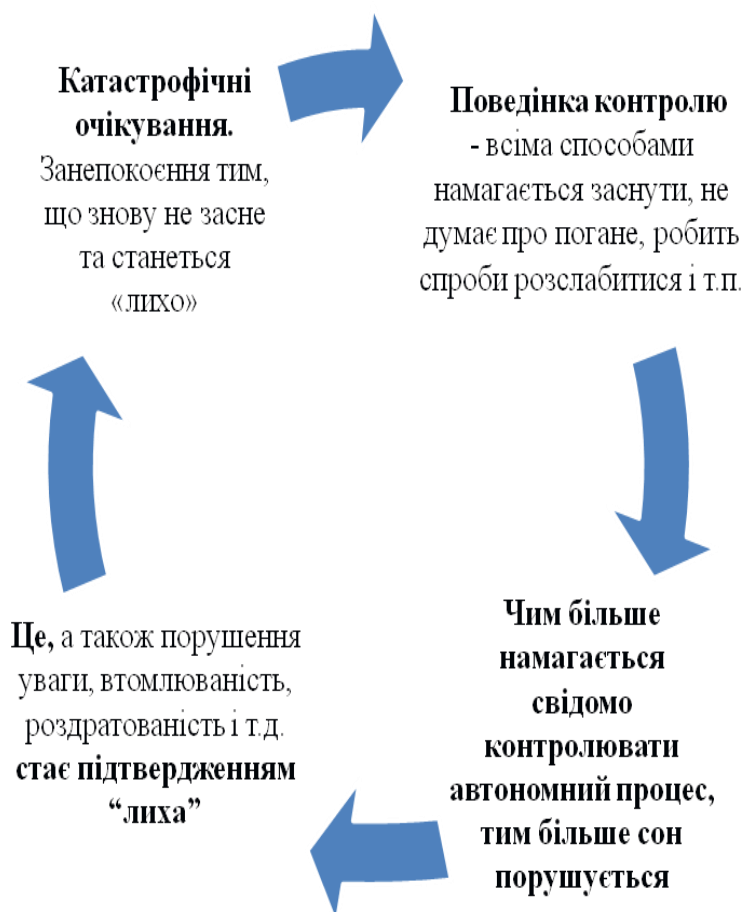
Рис.1. Підтримуючі механізми у порушеннях сну

Іншим не менш значимим фактором у генезі безсоння є поведінкові механізми підтримки порушень сну. Так, як видно з рис.1, одним з механізмів є використання поведінки контролю процесу засинання, внаслідок якого автоматичний процес переходу до сну ще більше порушується, а для клієнта це стає підтвердженням його катастрофічних когніцій. Поведінка контролю клієнтів може виражатись у намаганні в різний спосіб викликати сон, бути зосередженим на ньому, концентруватись на чомусь приємному з остраху не заснути, рахувати, відволікатись, не думати про погане, використовувати релаксації, перевіряти котра година, пити лікарські засоби тощо.