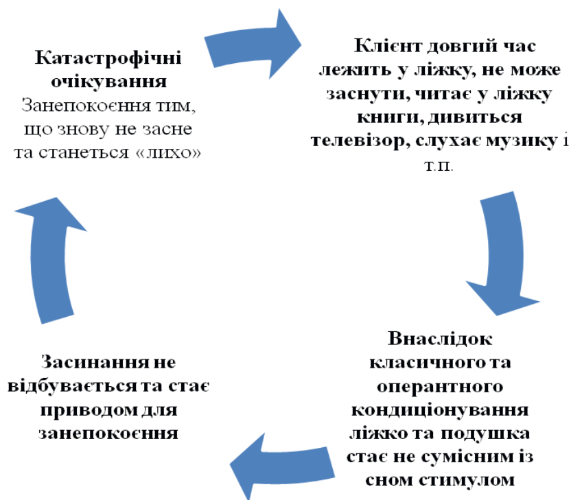
Рис.2. Підтримуючі механізми у порушеннях сну

До інших чинників порушення сну мають відношення: тривалість денного та нічного сну, відсутність стабільного графіку сну, фізичні навантаження та сильні емоціогенні ситуації перед сном, споживання їжі перед сном, кава, психостимулятори і т.п..