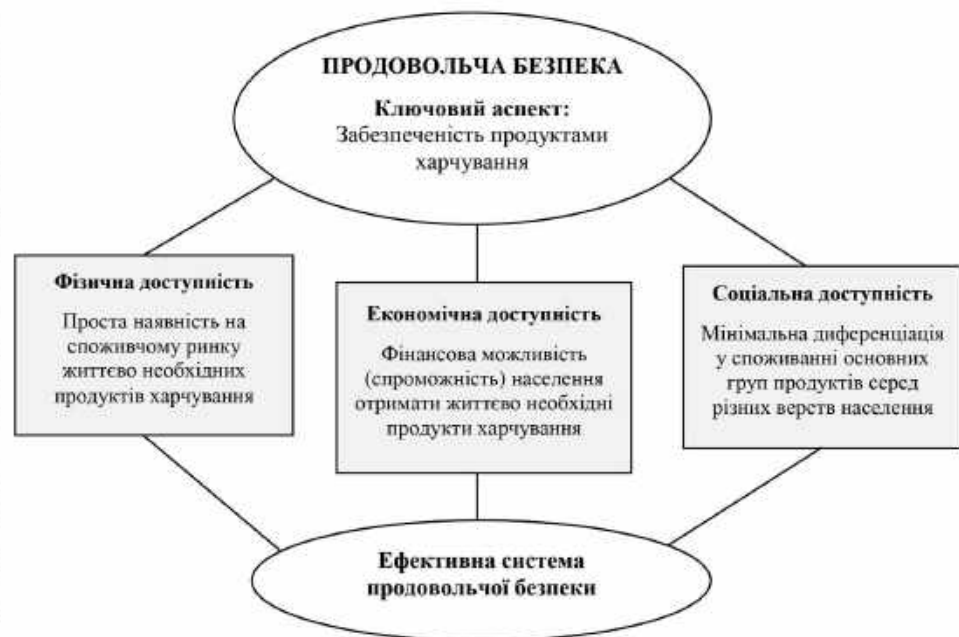
Рис. 1. Доступність харчових продуктів як фактор формування ефективною системи продовольчої безпеки

З 2011 року щорічно проводиться аналіз Глобального індексу продовольчої безпеки