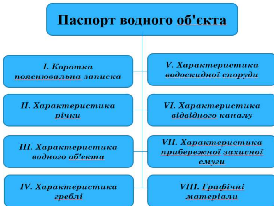
Рис. 2. Структура екологічного паспорта водного об'єкта

водного об'єкта". Метою паспортизації є упорядкування використання водних об'єктів, охорона їх від забруднення, засмічення і вичерпання, запобігання шкідливим діям вод і ліквідація їх наслідків, поліпшення стану водних об'єктів.