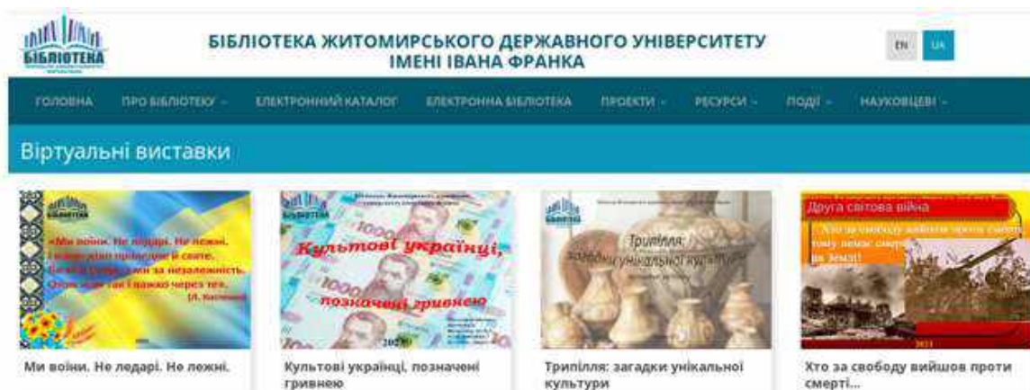
Рис. 1. Рубрика «Віртуальні виставки»

книгозбірні, а й інформаційні ресурси відкритого доступу. Публікуються на сайті Бібліотеки у розділі «Ресурси» у рубриці «Віртуальні виставки». Режим доступу: http://library.zu.edu.ua/presentations.html .