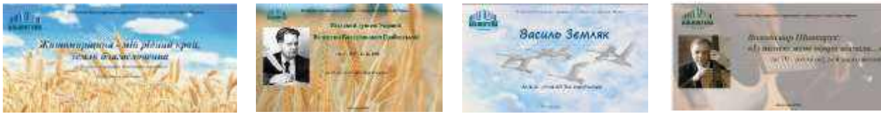
Рис. 6. Фрагмент краєзнавчих виставок

Різновидом віртуальних виставок є віртуальні презентації книг в рубриці «Радимо прочитати» http://library.zu.edu.ua/gr.html . Кожній книзі присвячена окрема сторінка, на якій розміщено фото обкладинки, рекомендаційна анотація. Книги, які пропонуються користувачам в цій рубриці згруповано за галузями знань: художня література; психологія, філософія, історія; природничі науки; іноземні мови; мистецтво; фізкультура, спорт, здоров'я.