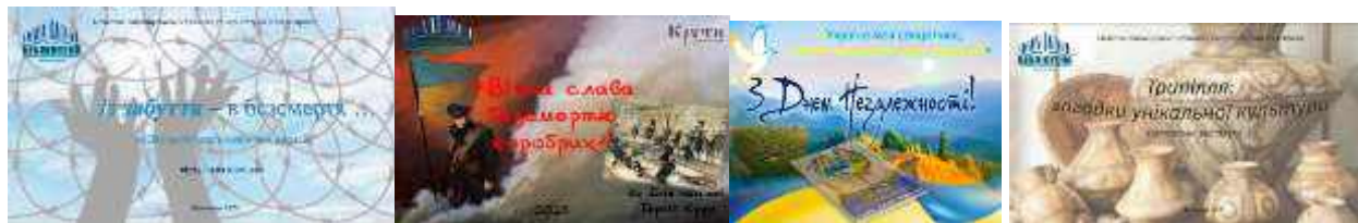
Рис. 2. Фрагмент книжкових виставок історичної тематики

Книжкові виставки, які об'єднує тема історії України: «Вічна слава безсмертно хоробрих» : до дня пам'яті героїв Крут 3 ; «Із забуття – в безсмертя ...» : до дня пам'яті жертв політичних репресій 4 ; до дня пам'яті героїв Небесної сотні – «Небесна сотня – то в серцях вогонь» 5 ; «Трипілля: загадки унікальної культури» : до 130-річчя з часу відкриття (1893) Трипільської культури 6 ; «Незалежна Україна на всі віки, на всі часи» : до дня Незалежності України 7 , та ін.