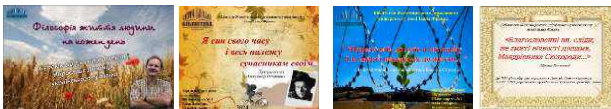
Рис. 5. Персональні виставки

Серед персональних виставок, що висвітлюють життя та діяльність видатних осіб – «Благословенні ви, сліди, не змиті вічності дощами, Мандрівника Сквороди...»; «Останній гетьман України»: до 150-річчя від дня народження Павла Скоропадського; «Народе мій, до тебе я ще верну і в смерті повернуся до життя...»: до 85-річчя від дня народження Василя Стуса; «Філософія життя людини на кожен день» до 65-річчя Мирослава Дочинця; «Я син свого часу і весь належу сучасникам своїм»: до 130-річчя від дня народження Олександра Довженка.