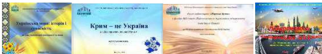
Рис.3. Фрагмент виставок, присвячених знаменним і пам'ятним датам і подіям

Серед книжкових експозицій вирізняються дизайном, естетичним оформленням виставки художньої літератури: «Український детектив», «Поезія – це завжди неповторність...: до Всесвітнього дня поезії, «Кохати генія»: красиві і трагічні історії жінок, «Екранізована класика: 15 шедеврів світової літератури», «Кохання втрюх, або любовний трикутник», «Сімейний роман. Українська родинна сага», «Майстер історичної та психологічної прози»: до 175 річчя Генріка Сенкевича, «Вернісаж сучасної саги».