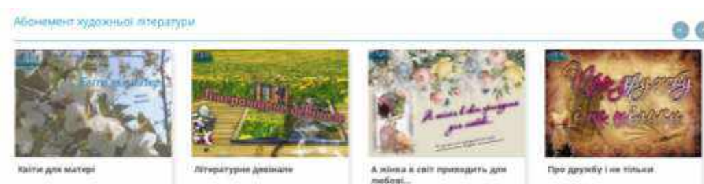
Рис. 4. Фрагмент виставок художньої літератури

Серед книжкових експозицій вирізняються дизайном, естетичним оформленням виставки художньої літератури: «Український детектив», «Поезія – це завжди неповторність...: до Всесвітнього дня поезії, «Кохати генія»: красиві і трагічні історії жінок, «Екранізована класика: 15 шедеврів світової літератури», «Кохання втрюх, або любовний трикутник», «Сімейний роман. Українська родинна сага», «Майстер історичної та психологічної прози»: до 175 річчя Генріка Сенкевича, «Вернісаж сучасної саги».