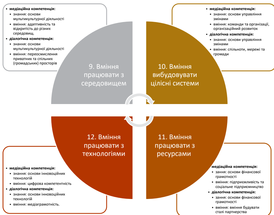
Схема 3. Медіаційна та діалогічна компетенції. Блок 3

публічних фахівців з медіації та діалогу від розуміння власних меж до супроводжування навчального процесу інших до розуміння власних меж до супроводжування освітнього процесу інших.