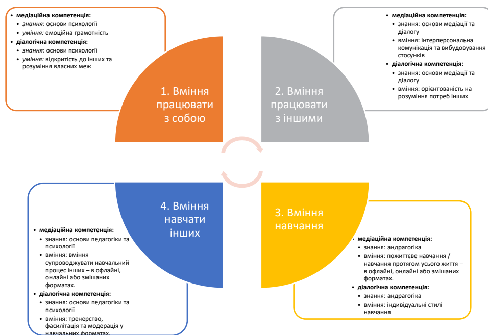
Схема 1. Медіаційна та діалогічна компетенції. Блок I

модерація у навчальних форматах, відкритість до інших (відкритість до себе).