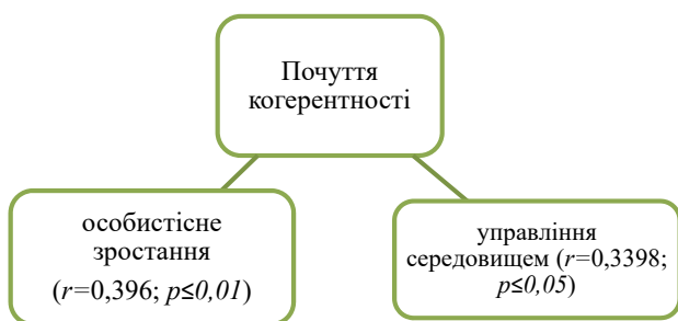
Рис. 1. Кореляційна плеяда взаємозв'язаних параметрів: почуття когерентності та психологічного благополуччя дорослої особистості

За результатами кореляційного аналізу нами встановлено позитивний кореляційний зв'язок почуття когерентності з мотивацією особистісного зростання ( r=0,396 ; p \leq 0,01 ) та компетентністю в управлінні середовищем ( r=0,3398 ; p \leq 0,05 ).