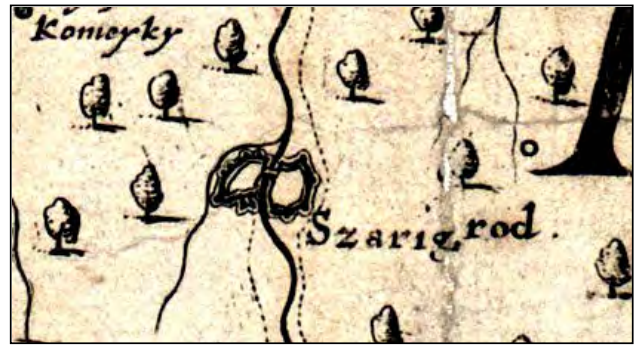
Рис. 1. Містечко Шаргород на карті Г. Боплана [10]

У 1635 році у Шаргороді збудовано великий склад вин та меду, купцям було заборонено возити ці товари іншим шляхом [7, с. 115]. У 40-х роках XVII сторіччя єврейська громада містечка була однією з найбільших у Поділлі. Різні автори зазначають від 300 до 1000 будинків у штетлі, який займав компактну територію Старого міста. Окрім єврейської, на території містечка було ще